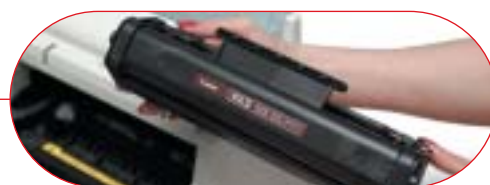
Alt-i-ett-kasset for enkelt vedlikehold og utskifting av toner.