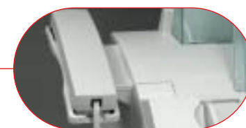
Du kan få telefonrør som tilleggsutstyr.